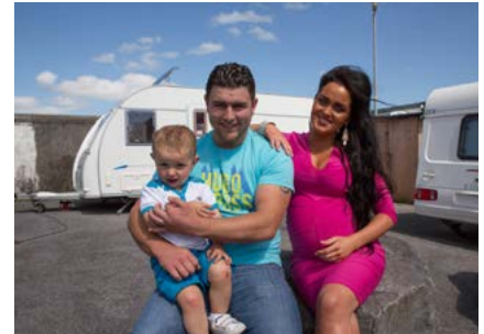
Meet the McDonaghs

Ar na cláir nua faoi chúrsaí coiriúlachta atá coimisiúnaithe le craoladh ar RTÉ2 i rith na bliana 2016, tá The Guards , sraith faire dhá chlár le Zucca Films maidir le hobair na ngardaí; agus Young, Dumb and Dangerous , sraith trí chlár le Stirling Productions i mBéal Feirste faoi choiriúlacht daoine óga, agus I Married My Son's Killer le Waddell Productions, i mBéal Feirste chomh maith.