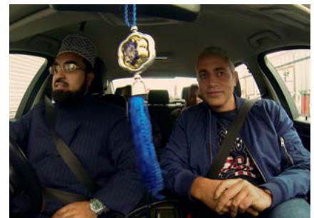
Baz: The Lost Muslim