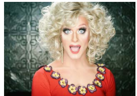
Panti Does 2015