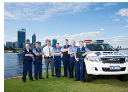
Gardaí Down Under

Saothar údair a bhí i Coming out of the Curve , arna scríobh ag Dónal Óg Cusack faoi chearta dhaoine homaighnéasacha. Clár aonair a bhí ann, a bhí tráthúil spreagúil, a craoladh roimh thráth an reifrinn maidir le comhionannas pósta agus a tharraing sciar mór den lucht féachana go dtí RTÉ One.