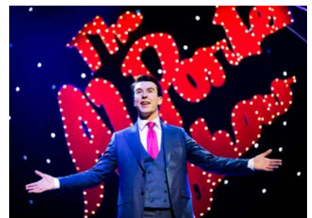
The AI Porter Show

Ní iondúil gur ábhar maith teilifíse é an galar dubhach agus bhí dúshlán i gceist lena chur i láthair ar RTÉ2, mar a bhí údar mórtais nuair a rinneadh sin