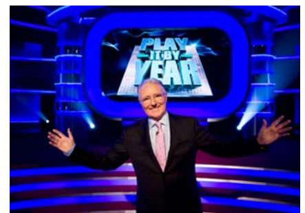
Play It by Year