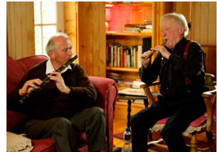
Paddy Moloney: Chieftain