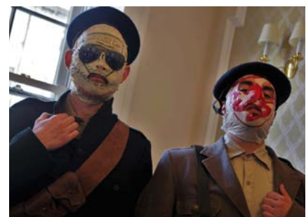
The Rubberbandits Guide to 1916