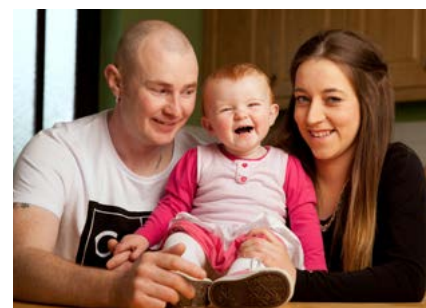
The Sound Barrier

Tá RTÉ tugtha do chláir réigiúnacha as ceantair taobh amuigh de Bhaile Átha Cliath a chruthú nó cláir arna gcoimisiúnú ag léiritheoirí atá lonnaithe taobh amuigh de Bhaile Átha Cliath.