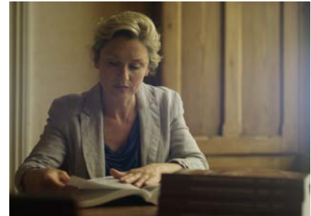
These Walls Can Talk

Ar na buaicphointí eile i rith na bliana 2015, bhí Crumlin , sraith faisnéise faire suite san ospidéal pédiatraice is mó in Éirinn inar scrúdaíodh an dul chun cinn i gcúrsaí leighis atá bunaithe ar an eolaíocht agus an teicneolaíocht. Craoladh dhá chlár fhaisnéise speisialta freisin faoin saol atá ag daoine in Éirinn atá bodhar nó nach bhfuil an éisteacht go maith acu: The Sound Barrier agus These Walls Can Talk . Craoladh an dá scannán sin mar chuid de sceideal bhuaicphointe RTÉ One agus cuireadh These Walls Can Talk – ina raibh iardhaltaí as Scoil Naomh Iósaif do Bhuachaillí Bodhra – i bhfoirm eile ISL (Teanga Chomharthaíochta Idirnáisiúnta) ar sheinnteoir an RTÉ Player.