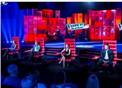
The Voice of Ireland