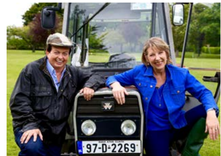
The Ploughing Live

Sraith de thrí chlár ón gComórtas Náisiúnta Treabhadóireachta a bhí in The Ploughing Live a craoladh beo sa sceideal roimh an tairseach ar RTÉ One agus a tharraing lucht féachana maith agus moladh ó lucht léirmheastóireachta. Clár fhaisnéise faoi luas ard, tréan ó thaobh stíle agus tapa ó thaobh léiriúcháin a bhí in The Bee agus Fab – The Night The Beatles Came to Dublin a craoladh ar RTÉ One chomh maith agus a bhí dírithe ar sheimpíní litrithe ar scoil agus ar thionchar cheolchoirmeacha a rinne The Beatles in Éirinn sa bhliain 1963.