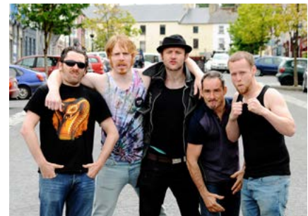
The Hardy Bucks Ride Again

Tá cothú agus forbairt ábhar nua grinn de chuid na hÉireann ar cheann de na tréithe sainiúla a bhaineann le RTÉ2