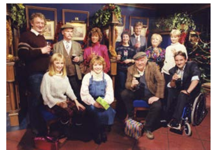
Well Holy God – It's Glenroe

Féachtar le ceisteanna a bhfuil tábhacht leo ag an ngnáthlucht féachana a léiriú ar chláir slite maireachtála RTÉ.