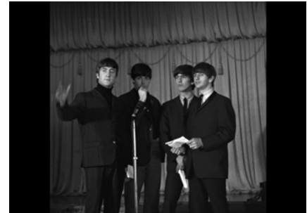
Fab – The Night The Beatles Came to Dublin