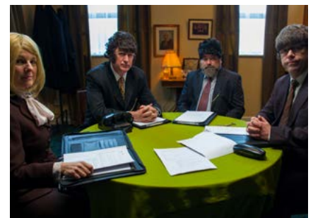
Irish Pictorial Weekly