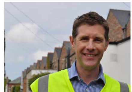
Room to Improve