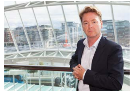
Ireland's Great Wealth Divide

Rinneadh réimse leathan de chlár fhaisnéise maidir le 1916 a chur ar coimisiún i rith 2014/2015, ina measc The Enemy Files , ina ndéanann Michael Portillo an bealach as Downing Street go dtí uaigheanna na bpoblachtánach i reilig Ghlas Naíon. Le linn na haistire, cuireann sé é féin agus an lucht féachana ar an eolas faoinar thit amach i mBaile Átha Cliath de réir na gcountas atá i gcartlanna sa Bhreatain – teachtaireachtaí lucht airm, cuimhní cinn pearsanta, tuairiscí faisnéise agus comhfhreagras oifigiúil. Foilsíonn Joe Duffy na scéalta tragóideacha faoi 38 leanbh a maraíodh i rith Éirí Amach na Cásca in Children of the Revolution . Cuirtear scéalta dochreidte faoi sheachtar ban, a ndearna