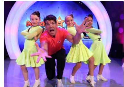
Donncha's Two Talented

Bliain mhaith maidir le cláir bheochana de chuid na hÉireann ar RTÉjr a bhí sa bhliain 2018. Bhí an tsraith nua do leanaí réamhscoile Mya Go (The Piranha Bar) ar na buaicphointí i sceideal an tsamhraidh le 52 clár faoi Mya Go agus í breá sásta