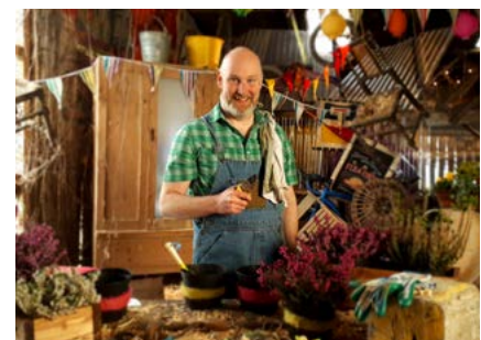
Living with a Fairy

Díríodh níos géire ar shiamsaíocht don teaghlach iomlán i rith na bliana 2018.