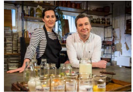
What Are You Eating?