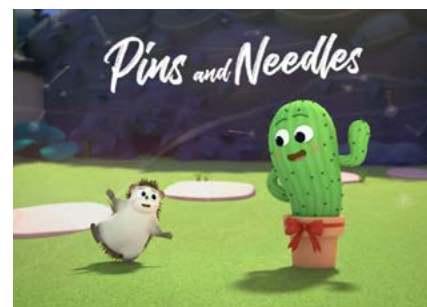
Pins and Needles