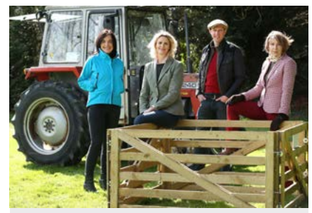
Big Week On The Farm

Leanadh den fhorás ar chláir fhíorasacha shainiúla i rith na bliana 2018 le sraith de thionscadail spéisiúla den nuacht a chuir le cláir réamhaitheanta a bhí á dtabhairt ar ais an athuir.