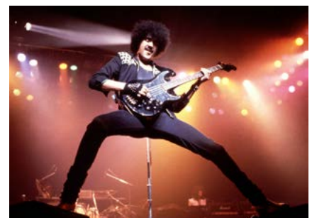
Phil Lynott – Scéalta ón Old Town