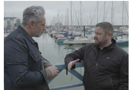
All Bets Are Off