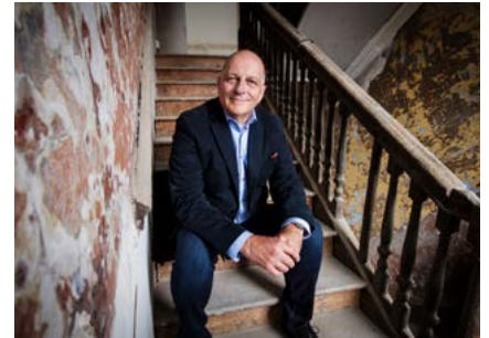
Great House Revival

D'éirigh go maith arís eile i rith na bliana 2018 le cláir agus sraitheanna faisnéise i rith na mbuaicthráthanna iarthairsí ar an Domhnach agus ar an Luan.