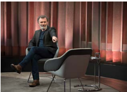
The Tommy Tiernan Show