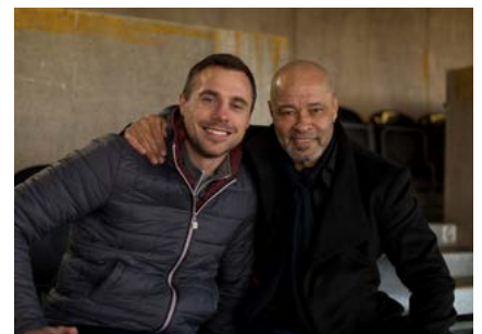
Tommy Bowe: The End Game