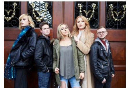
My Trans Life

Bhí an tóir chéanna arís eile ar First Dates agus Don't Tell the Bride , dhá shraith a léiríonn Coco Television, agus craoladh sraitheanna nua freisin de Say Yes To the Dress , arna léiriú ag Shinawil, agus This Crowded House , arna léiriú ag Indiepics.