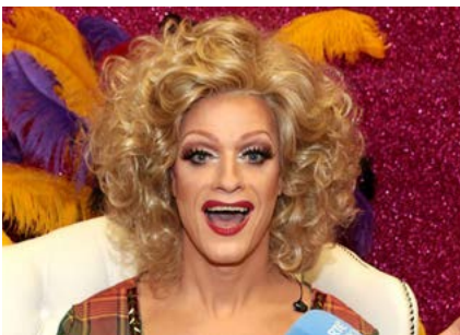
The Panti Monologues

Sa bhliain 2019, leanfaidh RTÉ Radio 1 ag cur le chomh maith is a d'éirigh le seónna a coimisiúnaíodh i mbabhtai roimhe seo agus ar éirigh go maith leo ach beidh aird freisin ar chomhlachtaí ar mian leo formáidí nua agus sraitheanna atá i mbéal forbartha a chur chun cinn.