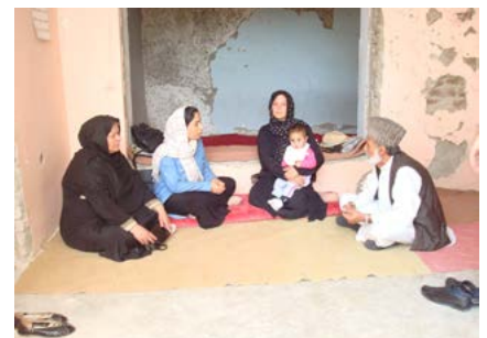
What in the World

Sa bhliain 2019, tá béim ar éagsúlacht de shraitheanna mórílimh a chur ar fáil ina ndéantar trácht ar scéalta móra suntasacha a bhféadfaí súil a choinneáil orthu ó bhliain go chéile ionas gur mó a théann an t-ábhar.