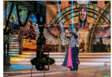
Dancing with the Stars