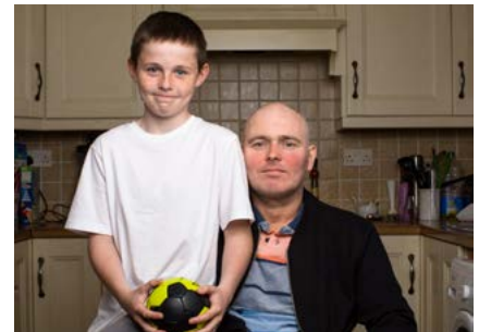
My Broken Brain

Leanadh den fhorás ar chláir fhíorasacha shainiúla i rith na bliana 2018 le sraith de thionscadail spéisiúla den nuacht a chuir le cláir réamhaitheanta a bhí á dtabhairt ar ais an athuir.