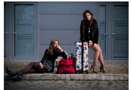
Can't Cope, Won't Cope