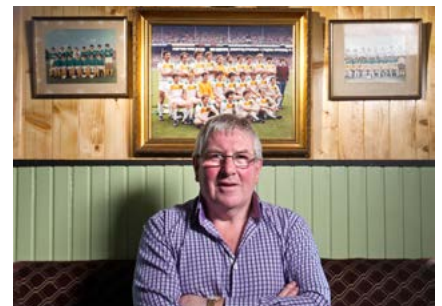
Players of the Faithful