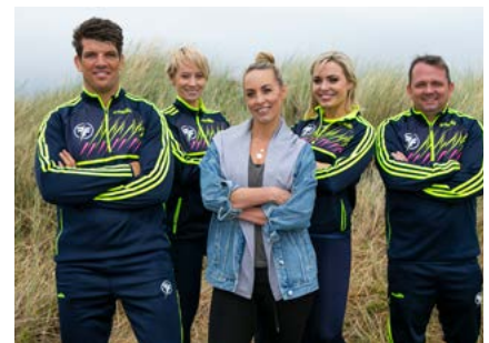
Ireland's Fittest Family

Bhí Brendan O'Connor ar ais ar theilifíseáin na hÉireann le dhá shraith de Brendan O'Connor's Cutting Edge (Mind the Gap Films).