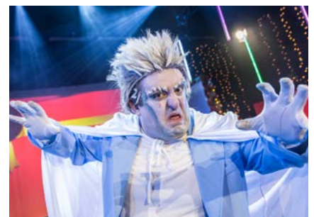
The Greatest Show... That Never Was!