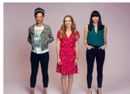
Women on the Verge

Chomh maith leis na cláir raidió a bhí coimisiúnaithe ag RTÉ, fuarthas 128 n-uair de chláir raidió le craoladh ó léiritheoirí neamhspleácha a bhfuil maoiniú ón Scéim Fuaim & Fís 3, a ritheann an tÚdarás Craolacháin, acu.