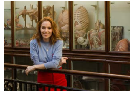
Growing Up Live