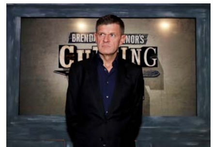
Brendan O'Connor's Cutting Edge

Bhí Brendan O'Connor ar ais ar theilifíseáin na hÉireann le dhá shraith de Brendan O'Connor's Cutting Edge (Mind the Gap Films).