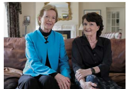
Eavan Boland: Is It Still the Same?

Bliain faoi leith a bhí sa bhliain 2018 maidir le cláir ealaíon choimisiúnaithe ar RTÉ le tionscadail uailmhianacha á gcur ar an aer ar RTÉ One i rith na bliana.