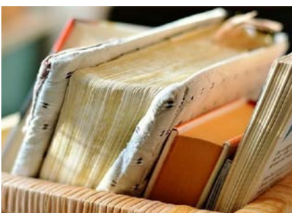
The Book Show

Bhí cabaret comhrá ar bun ag Panti Bliss maidir le hÉireannaigh na linne seo faoin tír sa lá atá inniu ann ar Pantisocracy chomh maith le sraith de shaothair friotail ó bhéal a chur i láthair ar The Panti Monologues faoin saol atá caite aici, an dá chlár á léiriú ag Athena Media.